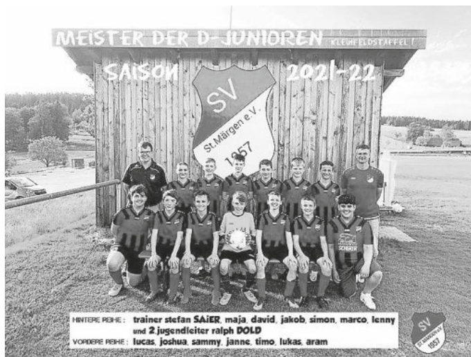
D-Jugend Mannschaft 2021/2022