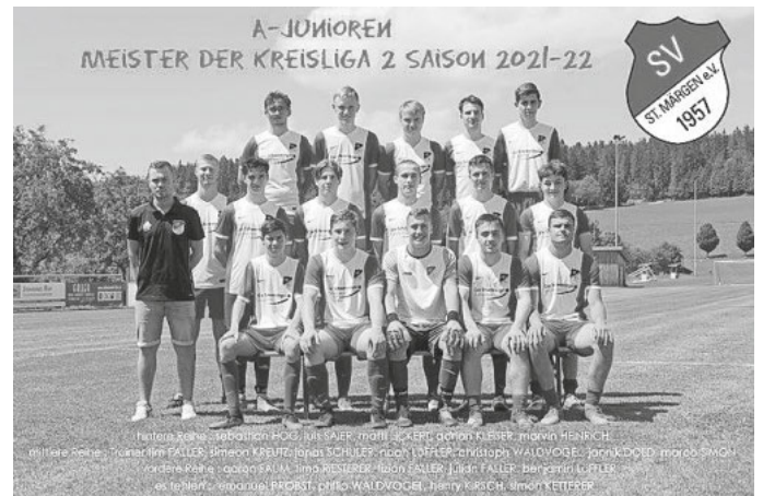
A-Jugend Mannschaft 2021/2022