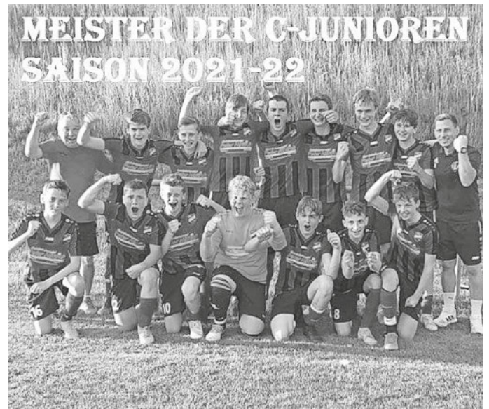
C-Jugend Mannschaft 2021/2022

Eure Jugendtrainer, Jugendleiter und Vorstandschaft des SV St. Märgen e.V.