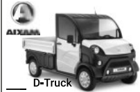
D-Truck Leichtmobile Tullastraße 6 79341 Kenzingen