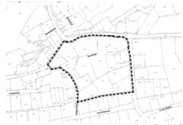
Geltungsbereich Bebauungsplan der Innenentwicklung „Gerbe“ (Gemeinde St. Peter)

In der Gemeinde St. Peter wurden die Bebauungspläne „Gerbe“ (Rechtskraft 24.01.2014) und „Wiehre - Nord“ (Rechtskraft 01.12.2017) als Bebauungspläne der Innenentwicklung nach § 13a BauGB aufgestellt.