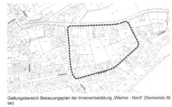
Geltungsbereich Bebauungsplan der Innenentwicklung „Wiehre - Nord“ (Gemeinde St. Peter)

Bebauungspläne der Innenentwicklung, die von den Darstellungen des FNP abweichen, können im beschleunigten Verfahren nach § 13a Abs. 2 Nr. 2 BauGB auch aufgestellt werden, bevor der FNP geändert oder ergänzt ist. Die geordnete städtebauliche Entwicklung des Gemeindegebietes darf nicht beeinträchtigt werden. Dies beinhaltet auch die Voraussetzung, dass von den Grundzügen der Planung des FNP, bezogen auf das jeweils gesamte Gemeindegebiet, nicht abgewichen werden darf. Der FNP ist dann nach Rechtskraft