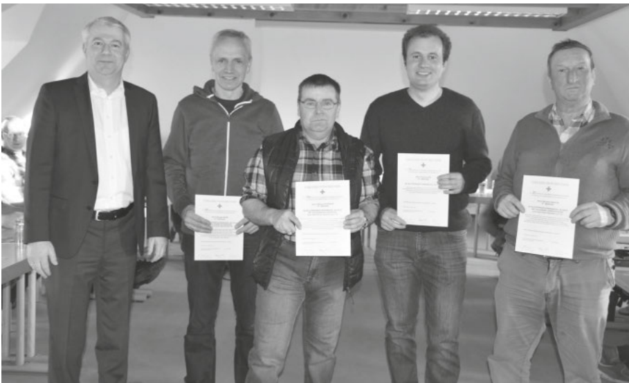
Die Blutspender erhalten ein Vesper im Gasthaus Rößle.