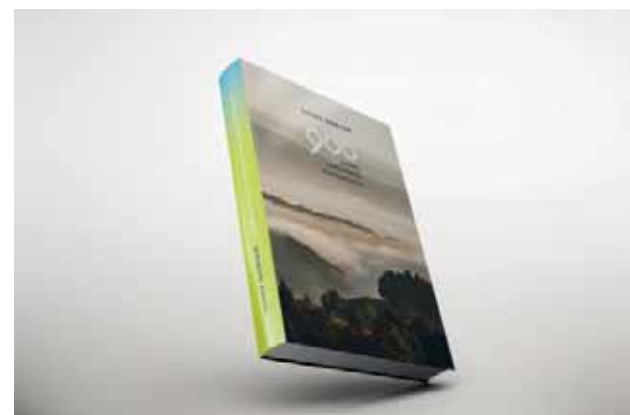
Das Buch ist ab dem 03.12.2017 erhältlich!

Für die Vermieter liegt Werbematerial bereit. Dies kann gerne abgeholt werden.