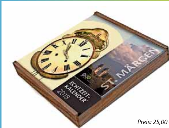
Preis: 25,00 €

Geschenkideen zum Jubiläum - folgende Artikel sind bei der Gemeindeverwaltung oder der Tourist-Information erhältlich