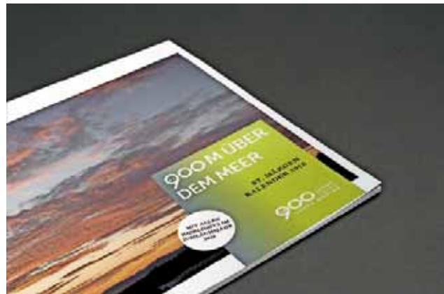
Wandkalender - Preis: 7,50 €