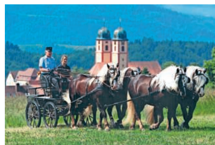
Schwarzwälder Kaltblut Kalender 2017: 15,00 €