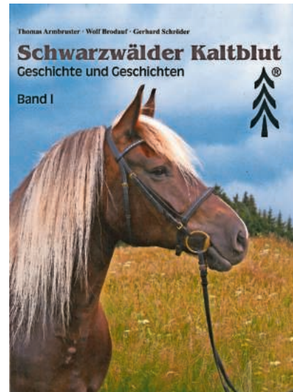
Schwarzwälder Kaltblut Band 1: 34,00 €