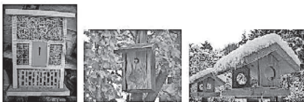
Insektenhotel, Nistkasten, Vogelfutterhäuschen

Bitte teilen Sie uns bei der Anmeldung mit, was Sie bauen möchten, damit wir für Sie das richtige Material vorbereiten können: